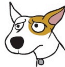
Froncer les sourcils, oreilles sur le côté (Brow Furrowed, Ears to Side)