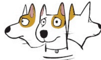
Être hypervigilant regarder dans plusieurs directions (Hypervigilant looking in many directions)