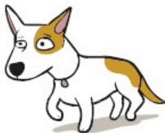
Bouger au ralenti marcher lentement sur le plancher (Moving in Slow Motion walking slow on floor)