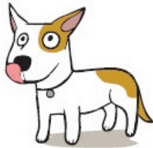
Lécher les babines en l'absence de nourriture (Licking Lips when no food nearby)