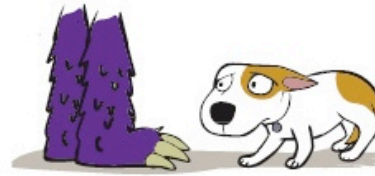
Se tapir de façon marquée (Major Cowering)