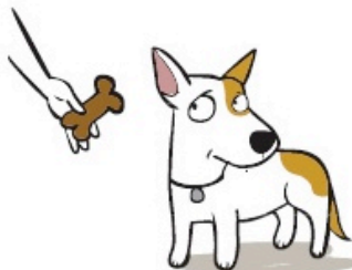
Refuser de manger soudainement malgré sa faim (Suddenly Won't Eat but was hungry earlier)