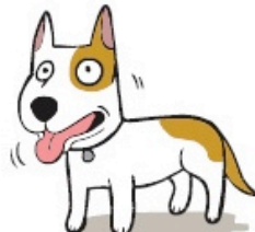
Haleter en absence de chaleur ou soif (Panting when not hot or thirsty)