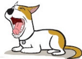
Paraître endormi ou bâiller sans être fatigué (Acting Sleepy or Yawning when they shouldn't be tired)